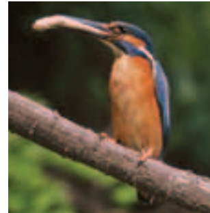
Rybárik riečny ( Alcedo atthis ) pripomína svojím sfarbením exotické tropické druhy

(územné vymedzenie, vlastnícke vzťahy, predmet ochrany, podmienky ochrany, finančné nástroje na zabezpečenie starostlivosti o územia a pod.) získate v regionálnych informačných strediskách Natura 2000, ktoré boli zriadené na pracoviskách Štátnej ochrany prírody a krajiny SR.