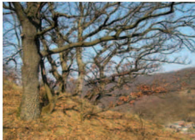
Pôvodné lesy s dubom cerovým sa zachovali už len na niektorých lokalitách Cerovej vrchoviny a Krupinskej planiny