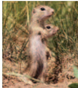
Syseľ pasienkový ( Spermophilus citellus ) obľubuje kosené lúky a pasienky