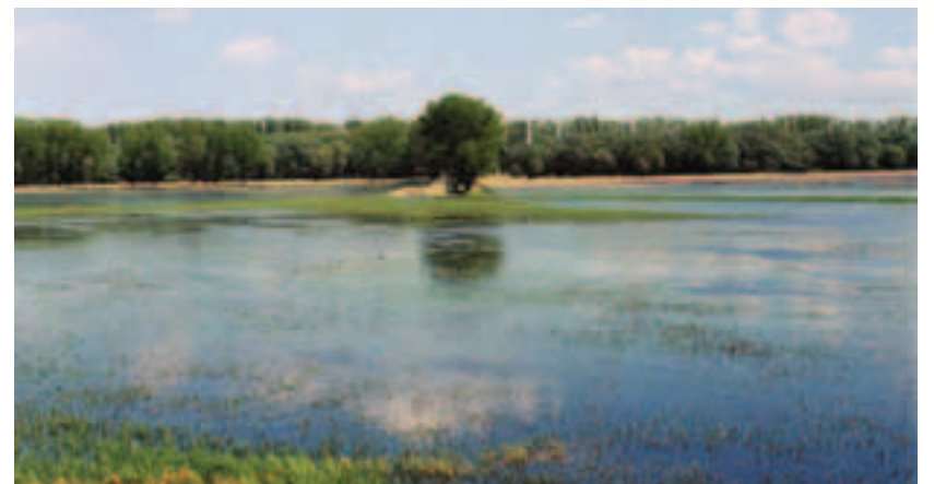
Nivným lúkam v povodí Poiplia prinášajú pravidelné záplavy dostatok živín

Správa CHKO Štiavnické vrchy Radničné námestie 18 969 01 Banská Štiavnica Tel.: 045 691 19 31