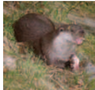
Vydra riečna ( Lutra lutra ) je výborný plavec vyžadujúci čisté vody s prirodzenými brehmi

(územné vymedzenie, vlastnícke vzťahy, predmet ochrany, podmienky ochrany, finančné nástroje na zabezpečenie starostlivosti o územia a pod.) získate v regionálnych informačných strediskách Natura 2000, ktoré boli zriadené na pracoviskách Štátnej ochrany prírody a krajiny SR.