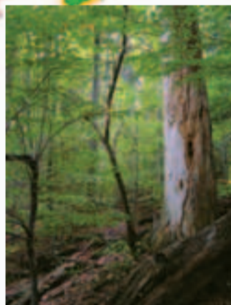
Pre biodiverzitu lesného ekosystému bukového lesa má veľký význam dostatok mŕtveho dreva