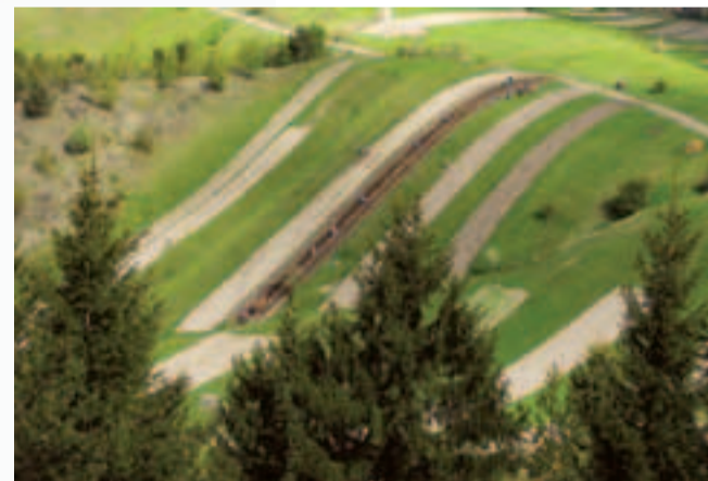
Na obhospodarovanie poľnohospodárskych pozemkov je možné získať podporu z európskych fondov z Plánu rozvoja vidieka