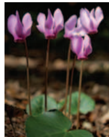
Európsky významný druh cyklámen fatranský ( Cyclamen fatrense ) sa vyskytuje len na vo Veľkej Fatre a v Nízkych Tatrách