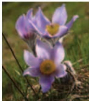
V rámci Európy má poniklec veľkokvetý ( Pulsatilla grandis ) centrum rozšírenia na Slovensku a v Maďarsku

(územné vymedzenie, vlastnícke vzťahy, predmet ochrany, podmienky ochrany, finančné nástroje na zabezpečenie starostlivosti o územia a pod.) získate v regionálnych informačných strediskách Natura 2000, ktoré boli zriadené na pracoviskách Štátnej ochrany prírody a krajiny SR.