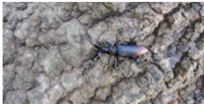
Fuzáč veľký ( Cerambyx cerdo ) patrí medzi naše najväčšie chrobáky