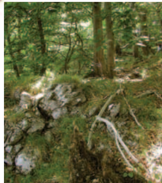
V ÚEV Baske sú hlavným predmetom ochrany biotopy vápnomilných bučín

Správa CHKO Ponitrie Samova ul. 3 949 01 Nitra Tel.: 037 651 54 20