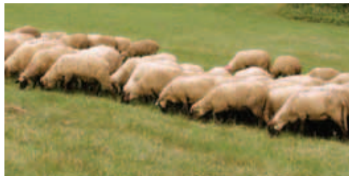
Na obhospodarovanie lúčnych a pasienkových biotopov je možné získať podporu z európskych fondov z Plánu rozvoja vidieka