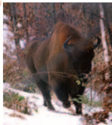
Navrátenie zubru hrivnatého ( Bison bonasus ) do jeho pôvodných biotopov v Poloninách pred dvoma rokmi bolo úspešné