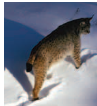
Rys ostrovid ( Lynx lynx ) je našou najväčšou mačkovitou šelmou