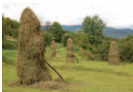
Tradičné obhospodarovanie lúčnych a pasienkových biotopov je podporované z európskych fondov z Plánu rozvoja vidieka

Číslovanie chránených vtáčích území je podľa Národného zoznamu. Územia európskeho významu nie sú číslované z dôvodu prehľadnosti mapy. Názvy jednotlivých území získate v regionálnych informačných strediskách.