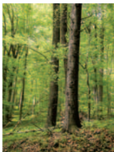
Pôvodné jedľovo-bukové lesy severovýchodu Slovenska sú nazývané aj „zelená pľúca Európy“

4. Financovanie realizácie hospodárskych či sociálnych opatrení, ktoré prispievajú k trvalo udržateľnému využívaniu území zaradených do sústavy chránených území Natura 2000, je vo veľkej miere možné z fondov prostredníctvom rôznych programov, napr. Plánu rozvoja vidieka.