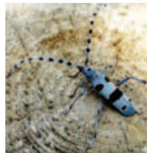
Fuzáč alpský ( Rosalia alpina ) je svojou farbou a kresbou nezameniteľným druhom

(územné vymedzenie, vlastnické vzťahy, predmet ochrany, podmienky ochrany, finančné nástroje na zabezpečenie starostlivosti o územie a pod.) získate v regionálnych informačných strediskách Natura 2000, ktoré boli zriadené na pracoviskách Štátnej ochrany prírody SR.