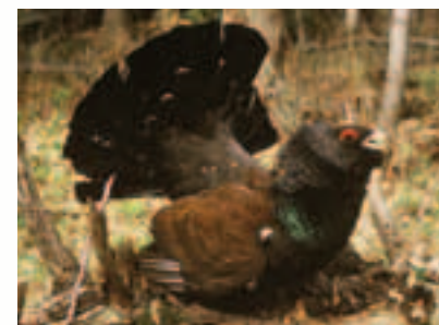
Tetrov hlucháň ( Tetrao urogallus ) sa vyskytuje len lokálne v starých prirodzených horských lesoch