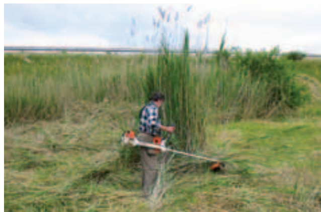
Kosenie trste je jedným z manažmentových opatrení v NPR Sivá Brada

Číslovanie chránených vtáčích území je podľa Národného zoznamu. Územia európskeho významu nie sú číslované z dôvodu prehľadnosti mapy. Názvy jednotlivých území získate v regionálnych informačných strediskách.