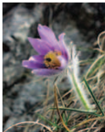
Poniklec slovenský ( Pulsatilla slavnica ) je symbolom krásy slovenskej kveteny

4. Financovanie realizácie hospodárskych či sociálnych opatrení, ktoré prispievajú k trvalo udržateľnému využívaniu území zaradených do sústavy chránených území Natura 2000, je vo veľkej miere možné z fondov prostredníctvom rôznych programov, napr. Plánu rozvoja vidieka.