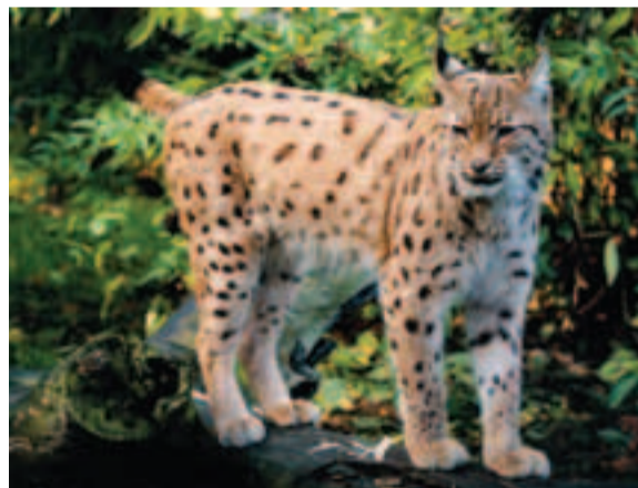
Rys ostrovid ( Lynx lynx ) je najväčšou mačkovitou šelmou našich hôr

SVM © Úrad geodézie, kartografie a katastra SR, 2000, č. 040/010205-AG Tematické spracovanie: © Štátna ochrana prírody SR, Banská Bystrica, 2006