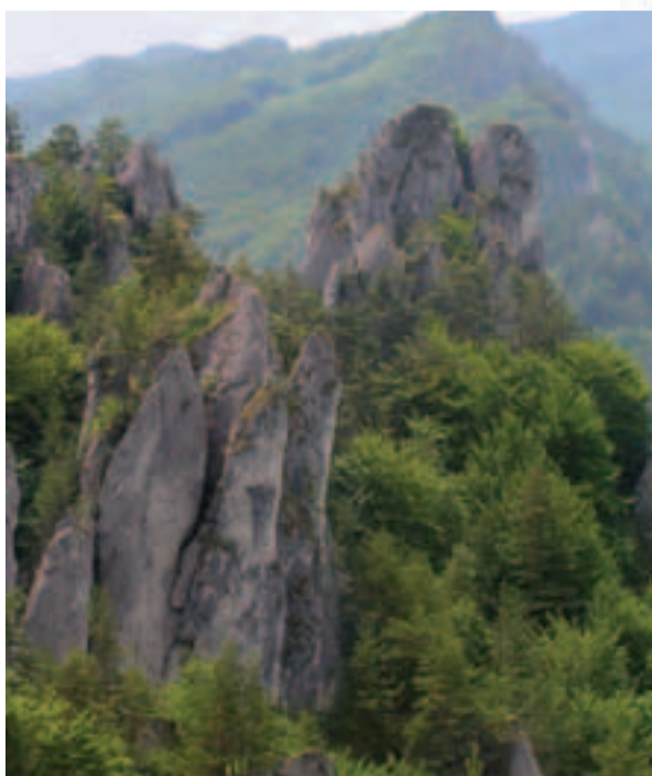
V Súľovských skalách sa vyskytujú veľmi hodnotné a dobre zachované reliktné boriny

Správa CHKO Kysuce U Tomali č. 1511 022 01 Čadca Tel.: 041 433 56 06