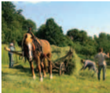
Tradičné obhospodarovanie lúčnych a pasienkových biotopov je podporované z európskych fondov z Plánu rozvoja vidieka

Číslovanie Chránených vtáčích území je podľa Národného zoznamu. Územia európskeho významu nie sú číslované z dôvodu prehľadnosti mapy. Názvy jednotlivých území získate v regionálnych informačných strediskách.