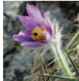
Poniklec slovenský ( Pulsatilla slavica ) je symbolom krásy slovenskej kveteny

(územné vymedzenie, vlastnícke vzťahy, predmet ochrany, podmienky ochrany, finančné nástroje na zabezpečenie starostlivosti o územia a pod.) získate v regionálnych informačných strediskách Natura 2000, ktoré boli zriadené na pracoviskách Štátnej ochrany prírody a krajiny SR.