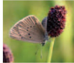
Jemné spôsoby obhospodarovania lúk zachovali populácie modráčika bahnskového ( Maculinea nausithous ), na niekoľkých vlhkých lúčkach v níve rieky Moravy

(územné vymedzenie, vlastnícke vzťahy, predmet ochrany, podmienky ochrany, finančné nástroje na zabezpečenie starostlivosti o územia a pod.) získate v regionálnych informačných strediskách Natura 2000, ktoré boli zriadené na pracoviskách Štátnej ochrany prírody a krajiny SR.