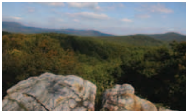
Ochrana biotopov v Malých Karpatoch je dôležitá aj z hľadiska výskytu vzácných druhov vtákov a ostatných druhov živočíchov