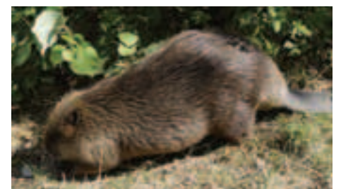
Do lužných lesov Slovenska sa opäť vrátil bobor vodný ( Castor fiber ), ktorý bol u nás v minulosti vyhubený

Číslovanie Chránených vtáčích území je podľa Národného zoznamu. Územia európskeho významu nie sú číslované z dôvodu prehľadnosti mapy. Názvy jednotlivých území získate v regionálnych informačných strediskách.