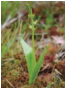
Hľuzovec Loeselov ( Liparis loeselii ) sa na Slovensku vyskytuje len na troch lokalitách, z ktorých dve sa vyskytujú na Záhorí