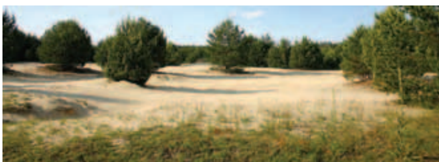
Na dopadových plochách vojenského výcvikového priestoru vznikajú vzácne iníciačné biotopy na pieskoch