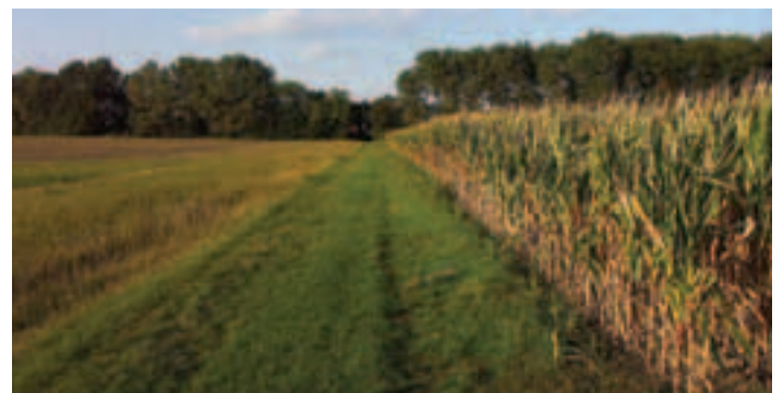
V intenzívne obhospodarovanej poľnohospodárskej krajine má veľký význam vytváranie trávnych pásov na ochranu viacerých druhov vtákov (Chránené vtáčie územie Lehnice)

Správa CHKO Štiavnické vrchy Radničné námestie 18 969 01 Banská Štiavnica Tel.: 045 691 19 31