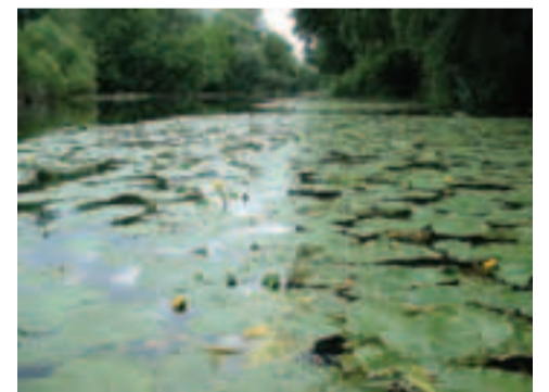
Na Klátovskom ramene sa vyskytujú mimoriadne cenné mokradné typy biotopov a druhov