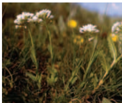
Peniažtek slovenský ( Thlaspi jankae ) je v rámci Európy kriticky ohrozený druh, ktorý sa vyskytuje len na niekoľkých lokalitách v Maďarsku a na Slovensku

Číslovanie chránených vtáčích území je podľa Národného zoznamu. Územia európskeho významu nie sú číslované z dôvodu prehľadnosti mapy. Ich názvy, ako aj ďalšie podrobnosti, získate v regionálnych informačných strediskách.