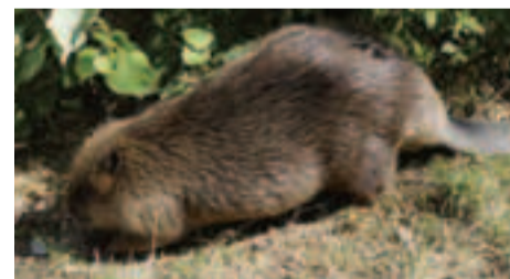
Do lužných lesov Slovenska sa opäť vrátil bobor vodný ( Castor fiber ), ktorý bol u nás v minulosti vyhubený