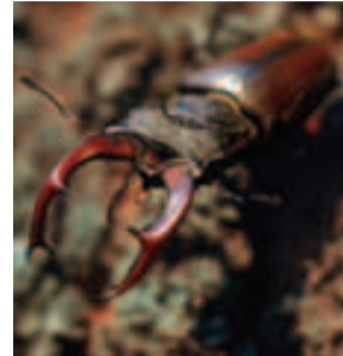
Roháč obyčajný ( Lucanus cervus )

(územné vymedzenie, vlastnícke vzťahy, predmet ochrany, podmienky ochrany, finančné nástroje na zabezpečenie starostlivosti o územia a pod.) získate v regionálnych informačných strediskách Natura 2000, ktoré boli zriadené na pracoviskách Štátnej ochrany prírody a krajiny SR.