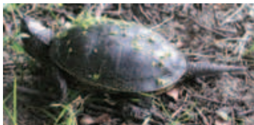
Korytnačka močiarna ( Emys orbicularis ) sa vyskytuje len na niekoľkých lokalitách na juhovýchode a juhozápade Slovenska