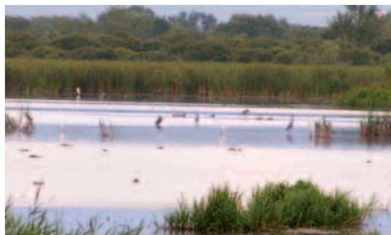
Vtáčí raj v Chránenom vtáčom území Senianske rybníky

Za účelom zvýšiť informovanosť verejnosti o takýchto chránených územiach aj prostredníctvom regionálnej tlače realizuje ŠOP SR projekt Optimalizácia komunikácie a informovania o chránených územiach zaradených do sústavy Natura 2000, ktorý je spolufinancovaný Európskou uniou.