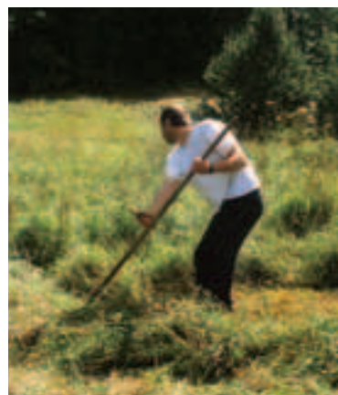
Tradičné obhospodarovanie lúčnych a pasienkových biotopov je podporované z európskych fondov z Plánu rozvoja vidieka

Číslovanie chránených vtáčích území je podľa Národného zoznamu. Územia európskeho významu nie sú číslované z dôvodu prehľadnosti mapy. Názvy jednotlivých území získate v regionálnych informačných strediskách.