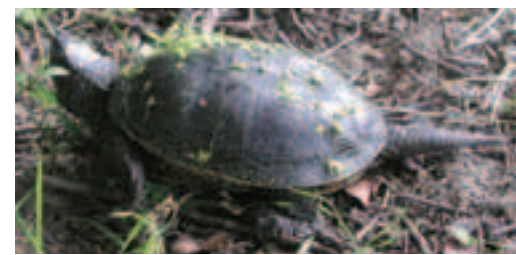
Korytnačka močiarna ( Emys orbicularis ) sa vyskytuje len na niekoľkých lokalitách na juhovýchode a juhozápade Slovenska