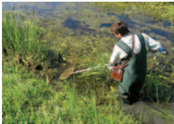
Prieskum vodných lokalít sa vykonáva s rybárskym agregátom