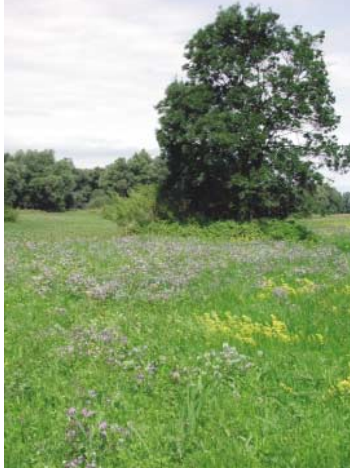
Alitum rieky Morava / Viera Stanová