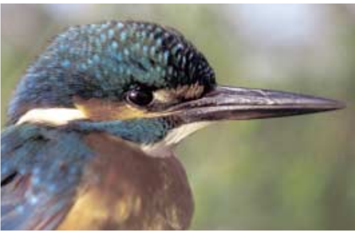
Rybník obyčajný / Brančo Mohár

Počet druhov vtákov a ich populácií, ktoré sa prirodzene vyskytujú na území členských štátov EÚ, klesá. Tento pokles ohrozuje biologickú rovnováhu a tým aj zachovanie zdravého životného prostredia. Keďže väčšina európskych druhov vtákov je sťahovavá, ich ochrana je problémom, ktorý prekračuje hranice štátov a vyžaduje si spoločnú zodpovednosť a spoluprácu viacerých krajín.