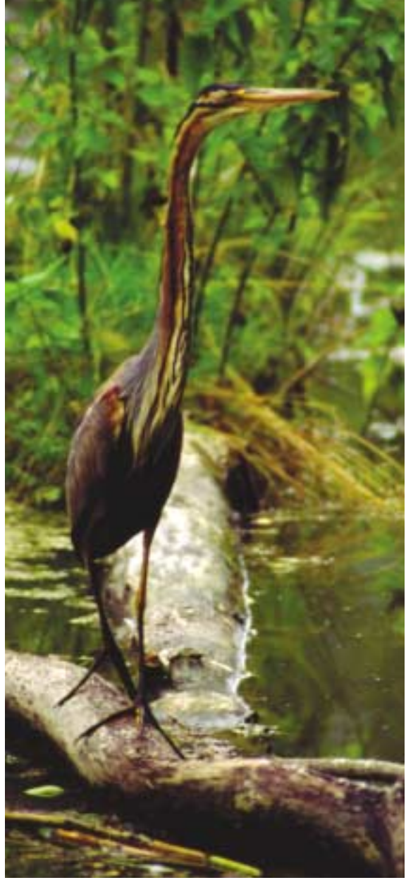
Volarka purpurová / Mírko Bohuš