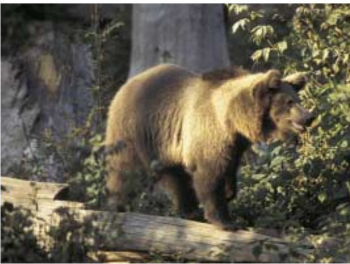
Medved' hnedý / Brnito Mlátnár

Výber území do sústavy chránených území Natura 2000 je založený výslovne na vedeckom základe. Opatrenia na zabezpečenie priaznivého vývoja týchto území z hľadiska ochrany prírody však berú do úvahy aj ekonomické, sociálne, kultúrne a regionálne požiadavky. Účelom vytvorenia tejto sústavy teda nie je izolovať chránené územia a vylúčiť z nich činnosť človeka, ale naopak, podstatou ich ochrany je zabezpečiť a podporiť tie aktivity, ktoré sú v súlade so záujmami ochrany prírody. Územia sústavy Natura 2000 budú súčasťou prostredia človeka, ktorý v nich žije, pracuje alebo ich navštevuje.