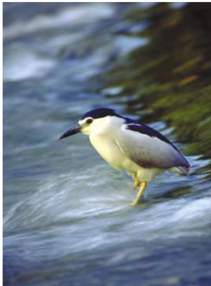
Bručiak nočný / Mírko Bohuš

Smernica chráni všetky pôvodné európske druhy, a to počas celého ich života, teda vajcia, mláďatá a hniezda. Okrem toho chráni aj biotopy, na ktoré sa jednotlivé druhy vtákov viažu. V praxi to znamená, že nikto nesmie usmrcovať, odchyťovať alebo inak poškodzovať žiaden vtáčí druh ani jeho hniezda a biotop, v ktorom žije. Zvláštny režim sa uplatňuje v prípade, ak ide o druhy, na ktoré sa môže poľovať. Smernica uvádza zoznam 181 druhov a poddruhov vtákov, pre ktoré sa spolu so sťahovavými vtákmi musia vyčleniť špeciálne chránené územia – chránené vtáčie územia.