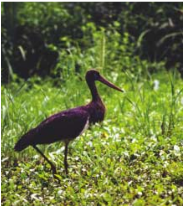
Bocian čierny / Mírko Bohuš

Smernica o vtákoch bola prijatá na ochranu všetkých voľne žijúcich druhov vtákov, ktoré sa prirodzene vyskytujú na území členských štátov EÚ.