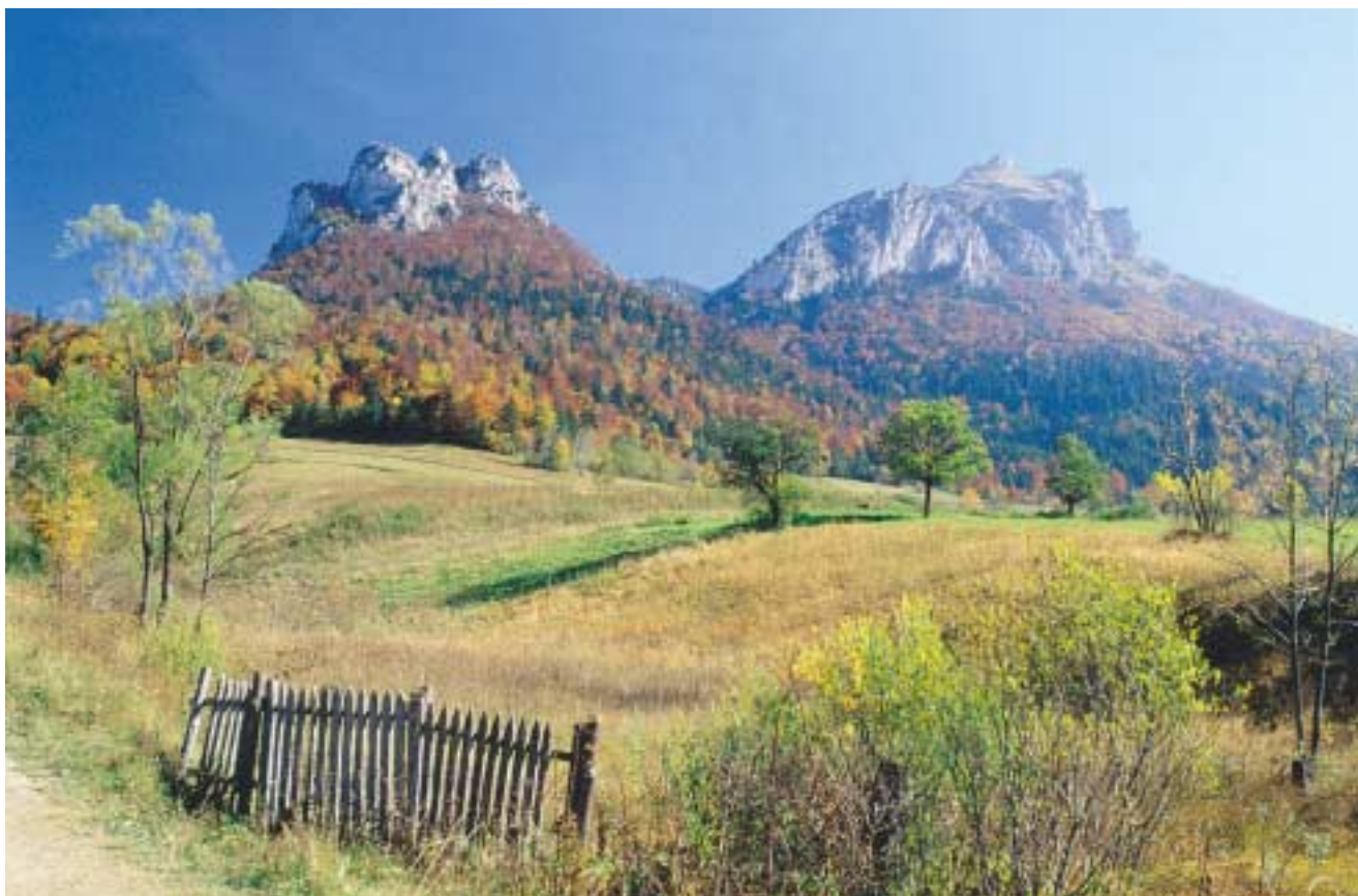
Veľký Rozsutec a Pohľadové skaly v Malej Fatre / Jaroslav Mikuš

The Habitats Directive: How it will apply in Great Britain. Department of the Environment, The Scottish Office, Joint Nature Conservation Committee.