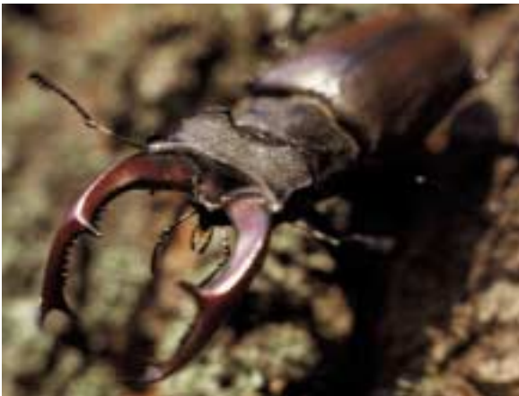
Roháčik obyčajný / ŠOP SR

Natura 2000 bude predstavovať sústavu chránených území európskeho významu vyhlásených na ochranu biotopov, živočíchov a rastlín, ktoré sú na území členských štátov EÚ vzácné alebo ohrozené.