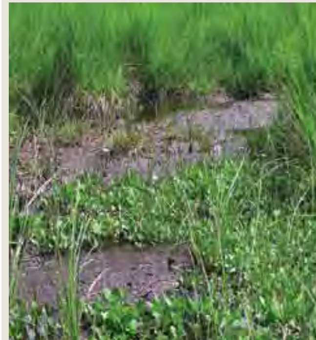
Vachta trojlístá ( Menyanthes trifoliata )