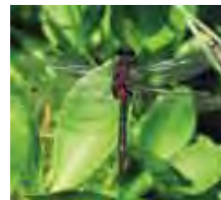
Vážka čiarkovaná ( Leucorrhinia dubia )

Všetky tieto ohrozenia spôsobujú zánik mnohých chránených druhov rastlín a živočíchov.