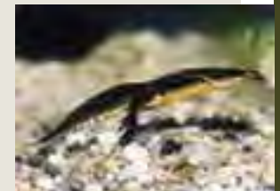
Mlok karpatský ( Triturus montandoni )