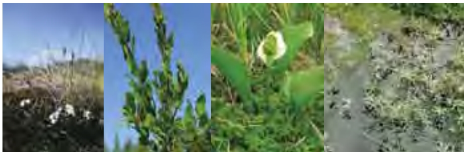
Brusnica obyčajná ( Vaccinium vitis-idaea ) Vrba čučoriedková ( Salix myrtilloides ) Diablik močiarny ( Calla palustris ) Nátržnica močiarna ( Comarum palustre )

Veľmi vzácnym druhom motýľa je žltáčik čučoriedkový ( Colias palaeno ), ktorého húsenice sa živia výlučne listami čučoriedky barinnej. Z vtákov je to močiarnica mekotavá ( Gallinago gallinago ), prhlaviar červenkastý ( Saxicola rubetra ) a červenák karmínový ( Carpodacus erythrinus ).