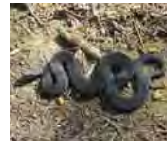
Vretenica obyčajná ( Vipera berus )