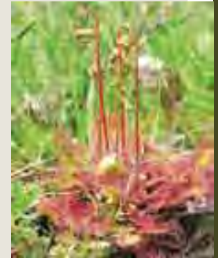
Rosička okrúhlostá ( Drosera rotundifolia )