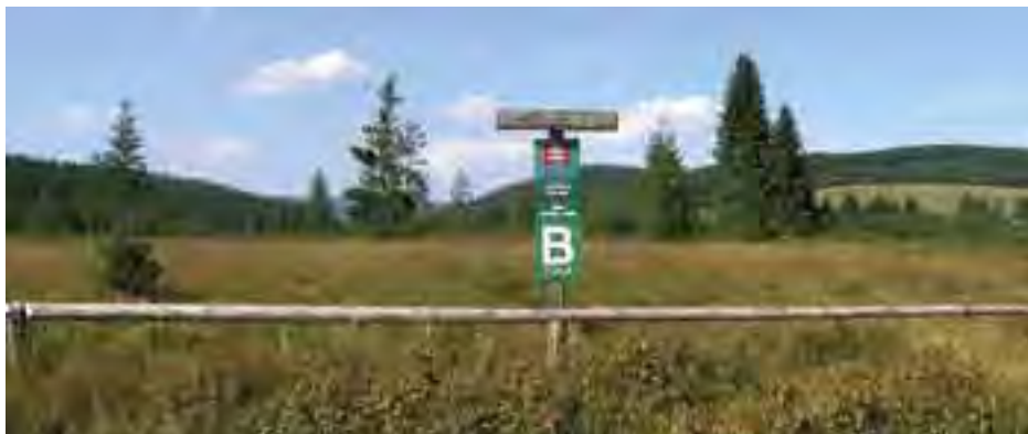
Mútňanské rašelinisko – tabuľa územia