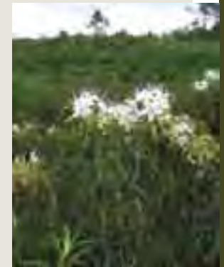
Rojovník močiarny ( Ledum palustre )