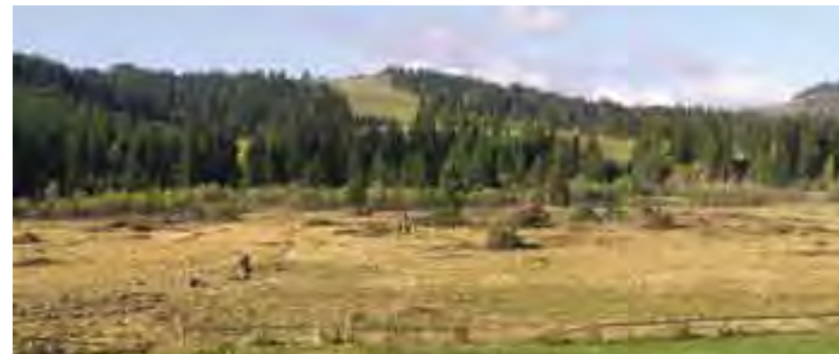
Kosenie na Beňadovskom rašelinisku

Každé územie európskeho významu sa po schválení Národného zoznamu navrhovaných ÚEV vládou SR (17. 3. 2004) považuje za chránené územie. Je to štádium tzv. predbežnej ochrany , ktorej cieľom je zabezpečiť, aby sa stav európsky významných druhov a biotopov v území nezhoršoval. Toto obdobie môže trvať až 9 rokov, pričom počas prvých 3 rokov je národný zoznam posudzovaný v Európskej komisii a dochádza k definitívnemu výberu územia do sústavy NATURA 2000 a do maximálne ďalších 6 rokov dôjde k vyhláseniu územia. Predbežná ochrana je realizovaná prostredníctvom stupňov ochrany uvedených v národnom zozname. Podrobný zoznam parciel so zaradením k príslušnému stupňu ochrany pre ÚEV Rašeliniská Bielej Oravy, ako aj všetky ďalšie informácie o sústave NATURA 2000 na Slovensku nájdete na www.sopsr.sk/natura .