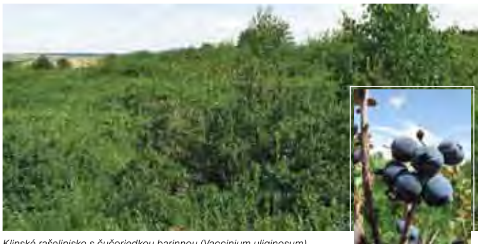
Klínske rašelinisko s čučoriedkou barinnou ( Vaccinium uliginosum )

Beňadovské rašelinisko patrí k najvýznamnejším lokalitám prechodných rašelinísk na Slovensku, s výskytom vzácných a ohrozených druhov tráv – ostríc: ostrice výbežkatej ( Carex chondrorhiza ) ostrice plstnatoplodej ( Carex lasiocarpa ) a ostrice barinnej ( Carex limosa ) a rôznym druhom machov, ktoré sú pozostatkom z poslednej doby ľadovej ( Helodium blandowii , Meesia triquetra ).