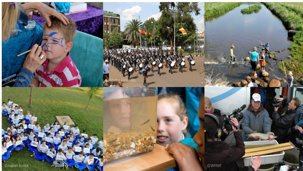
Podujatia k SDMR

Milióny ľudí na celom svete sú odkázané na sladkovodné druhy migrujúcich rýb, ktoré predstavujú hlavný zdroj ich stravy a obživy. Napríklad až 50 miliónov ľudí je svojou stravou a životným závislých na rieke Mekong. V iných oblastiach migrujúce ryby a ich potomstvo predstavujú dôležitý zdroj potravy pre iné druhy sladkovodných a morských rýb dôležitých z ekologického hľadiska a pre komerčné využitie. Kolaps mnohých populácií rýb má devastačný vplyv na potravinovú bezpečnosť týchto ľudí a milióny najchudobnejších obyvateľov sveta.