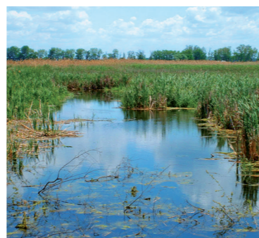
Ramsarská lokalita Parížske močiare