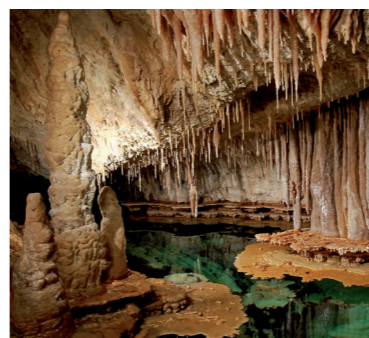
Ramsarská lokalita Jaskyne Demänovskej doliny