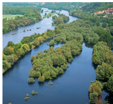
Ramsarská lokalita Niva Moravy