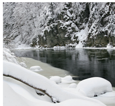
Ramsarská lokalita Rieka Orava a jej prítoky