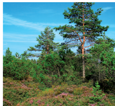
Ramsarská lokalita Mokrade Oravskej kotliny