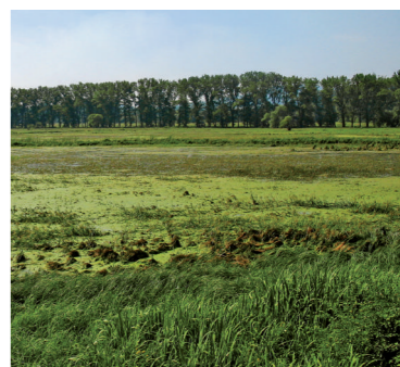
Ramsarská lokalita Poiplie