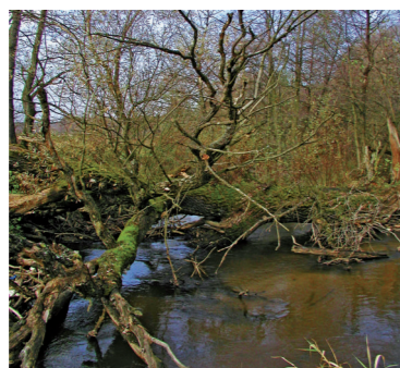
Ramsarská lokalita Alúvium Rudavy