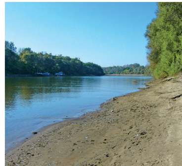
Ramsarská lokalita Alúvium Tisy