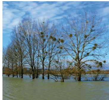
Ramsarská lokalita Latorica