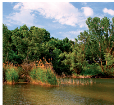
Ramsarská lokalita Dunajské luhy