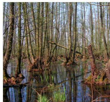
Ramsarská lokalita Šúr