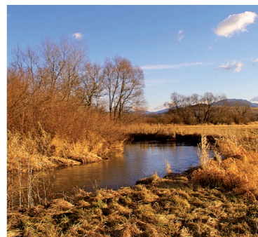
Ramsarská lokalita Mokrade Turca