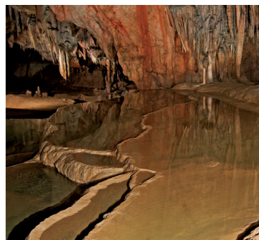
Ramsarská lokalita Domica

Viac informácií nájdete na www.sopsr.sk , www.cwi.sk , www.ramsar.org a www.daphne.sk