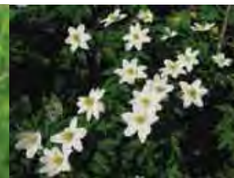
Veternica hájna ( Anemone nemorosa )