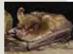
Netopier brvitý ( Myotis emarginatus )