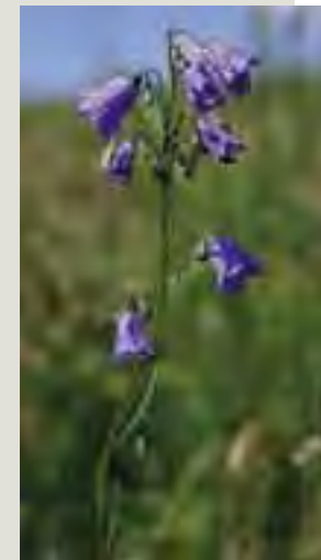
Zvonček hrubokoreňový ( Campanula serrata )

Cicavce netopier brvitý Myotis emarginatus netopier obyčajný Myotis myotis vydra riečna Lutra lutra