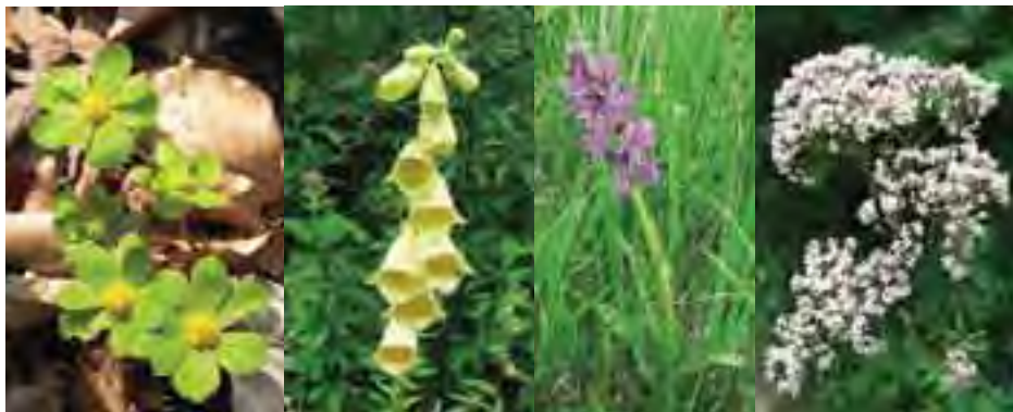
Hviezdnatec čemerícový ( Hacquetia epipactis )