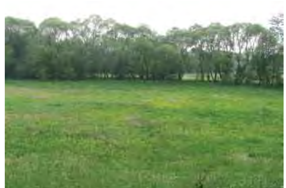
Brehové porasty potoka Žarnovica