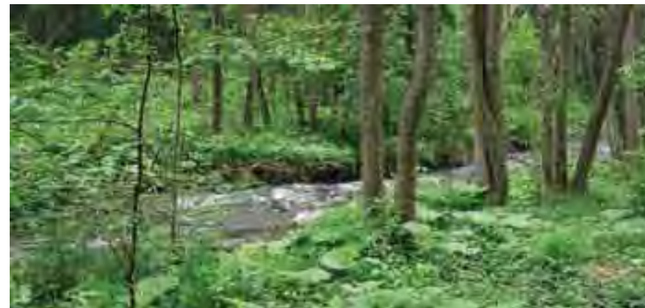
Interiér lužného lesa sprevádzajúceho tok Žarnovica

Stupne ochrany. Podľa zákona č. 543/2002 Z. z. o ochrane prírody a krajiny je územná ochrana na Slovensku diferencovaná podľa stupňov ochrany. Najmenšie obmedzenia v prospech ochrany prírody predstavuje 1. stupeň (platí na celom území SR), najprísnejší je 5. stupeň (o. i. zahŕňa zákaz pohybu mimo vyznačených turistických chodníkov, zberu plodov a rušenia pokoja v záujme prítomných živočíchov a samozrejme vylučuje hospodársku činnosť). V prípade zónovania územia, jednotlivým zónam zodpovedajú príslušné stupne ochrany (zóna A = 5. stupeň, zóna B = 4. stupeň, zóna C = 3. stupeň, zóna D = 2. stupeň. 1. stupeň nemá pridelenú zónu).