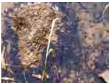
Žubrienky skokana hnedého ( Rana temporaria )