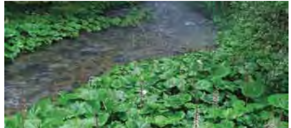
Brehové porasty deväťsilov

Geologický podklad tvoria fluviálne sedimenty – piesčité hliny nív, štrky a piesky nív, v ktorých sa nachádza materiál z okolitých pohorí pochádzajúci z miocénnych hornín flochovskej formácie, sivých slienitých vápencov a slieňovcov mráznickeho súvrstvia krížňanského príkrovu a triasových vápencov a dolomitov.