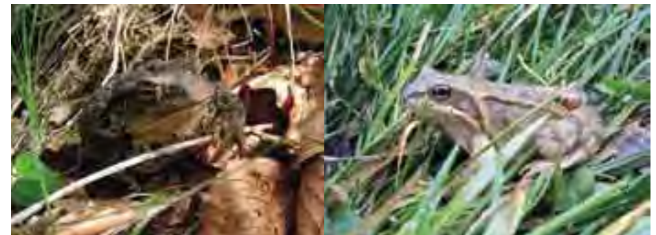
Ropucha bradavičnatá (Bufo bufo)

Územie tvorí zachovalý úsek podhorského toku a riečnych ekosystémov s vyvinutými morfológickými tvarmi (meandre, ramená), brehovou vegetáciou a aluviálnymi mokraďami vytvárajúcimi veľmi dobré podmienky pre existenciu a rozmnožovanie niektorých vzácných a ohrozených rastlín a živočíchov. Predstavuje súčasť jadrového areálu výskytu vydry riečnej ( Lutra lutra ) v povodí rieky Turiec. Potok Žarnovica priteká z Veľkej Fatry ako pravostranný prítok rieky Turiec. Bystrinný charakter toku sa tu mení na podhorský.