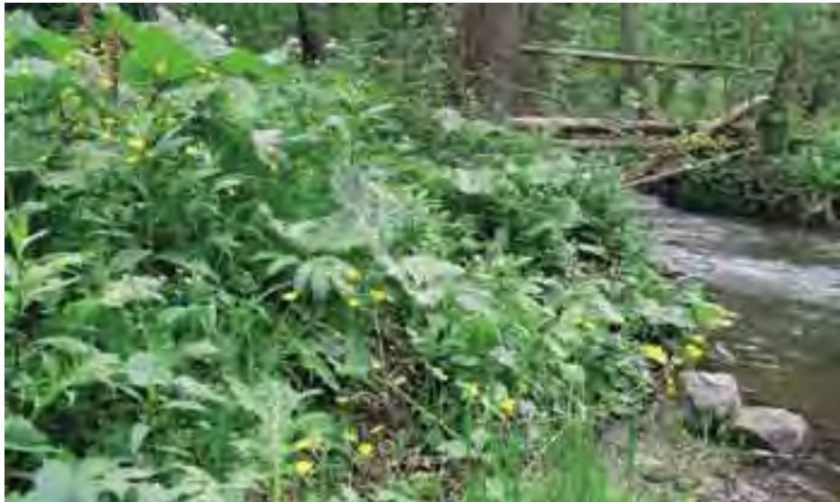
Vysokobylinné porasty na brehoch Žarnovice

Geologický podklad tvoria fluviálne sedimenty – piesčité hliny nív, štrky a piesky nív, v ktorých sa nachádza materiál z okolitých pohorí pochádzajúci z miocénnych hornín flochovskej formácie, sivých slienitých vápencov a slieňovcov mráznickeho súvrstvia krížňanského príkrovu a triasových vápencov a dolomitov.