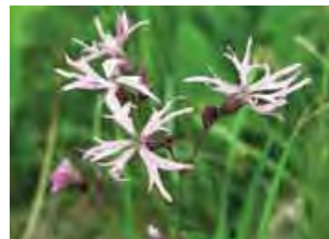
Kukučka lúčna ( Lychnis flos-cuculi )

Zonácii územia a vypracovaniu programu starostlivosti s navrhovanými opatreniami bude predchádzať ich prerokovanie so zainteresovanými vlastníkmi a užívateľmi územia. Nezávisle na tomto procese môžete s otázkami a návrhmi už teraz kontaktovať pracovníkov ŠOP SR – Správy NP Veľká Fatra.