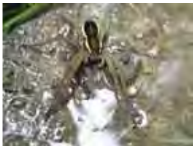
Lovčík vodný ( Dolomedes fimbriatus )