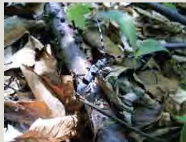
Fuzáč alpský ( Rosalia alpina )