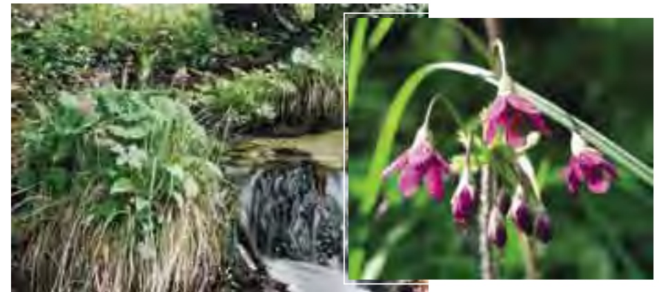
Kortúza Matthioliho (Cortusa matthioli), vpravo detail kvetu