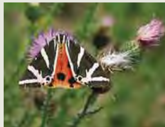
Spriadač kostihojový ( Callimorpha quadripunctaria )