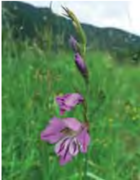
Mečik škridlicový ( Gladiolus imbricatus )