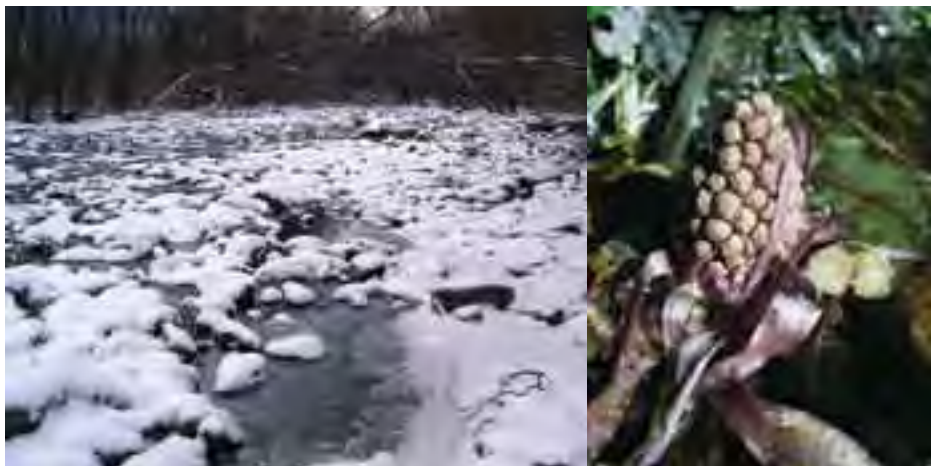
Odbermi vody oslabená rieka Revúca