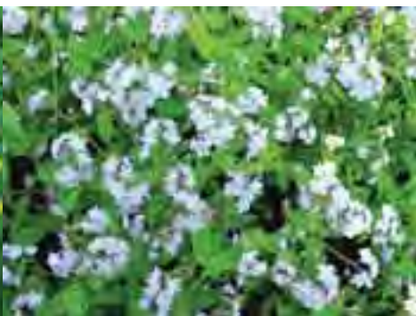
Nezábudka ( Myosotis sp. )