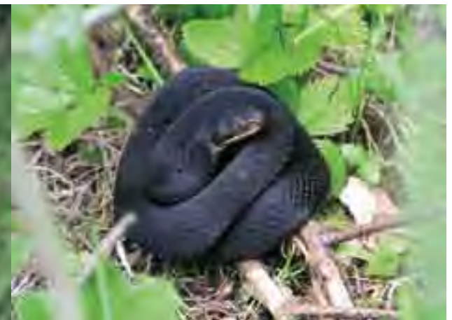
Vretenica severná ( Vipera berus )