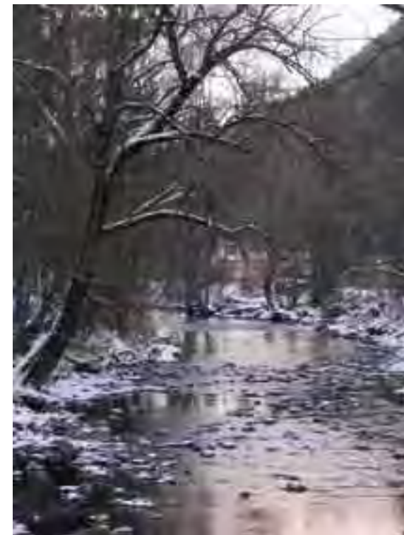
Prirodzené brehy rieky

Vypracovaniu programu starostlivosti s navrhovanými opatreniami bude predchádzať ich prerokovanie so zainteresovanými vlastníkmi a užívateľmi územia. Nezávisle na tomto procese môžete s otázkami a návrhmi už teraz kontaktovať pracovníkov ŠOP SR – Správy NP Veľká Fatra.