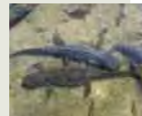
Mlok vrchovský ( Triturus alpestris )