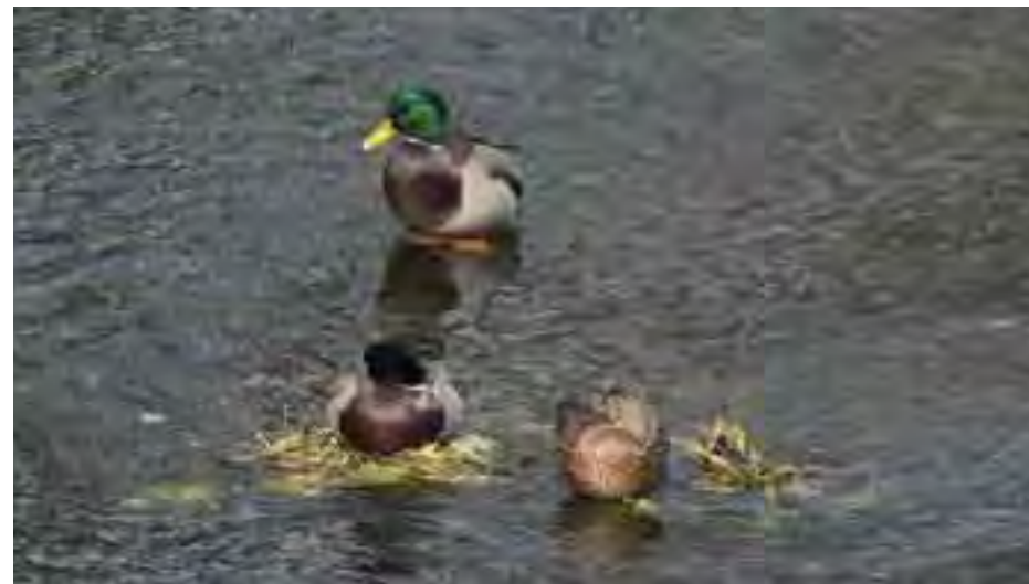
Kačica divá ( Anas platyrhynchos )

Každé územie európskeho významu sa po schválení Národného zoznamu navrhovaných ÚEV vládou SR (17. 3. 2004) považuje za chránené územie. Je to štádium tzv. predbežnej ochrany , ktorej cieľom je zabezpečiť, aby sa stav európsky významných druhov a biotopov v území nezhoršoval. Toto obdobie môže trvať až 9 rokov, pričom počas prvých 3 rokov je národný zoznam posudzovaný v Európskej komisii a dochádza k definitívnemu výberu územia do sústavy NATURA 2000 a do maximálne ďalších 6 rokov dôjde k vyhláseniu územia. Predbežná ochrana je realizovaná prostredníctvom stupňov ochrany uvedených v národnom zozname. Podrobný zoznam parciel so zaradením k príslušnému stupňu ochrany pre ÚEV Revúca, ako aj všetky ďalšie informácie o sústave NATURA 2000 na Slovensku nájdete na www.sopsr.sk/natura .