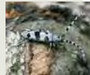
Fuzáč alpský ( Rosalia alpina )

– Pseudogaurotina excellens fuzáč alpský Rosalia alpina bystruška potočná Carabus variolosus