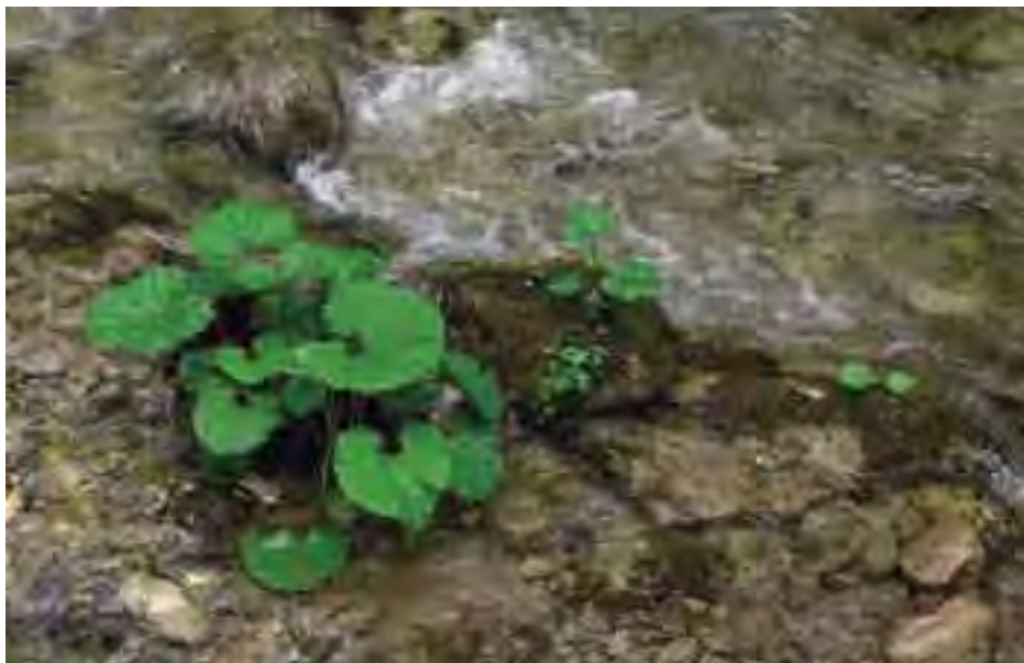
Tok má na veľkej časti bystrinný charakter