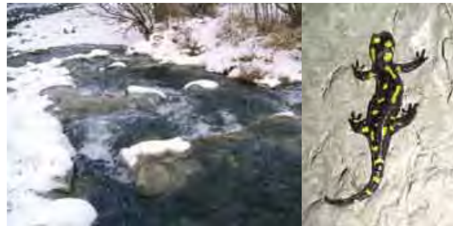
Rieka Revúca v zime

Kostru navrhovaného územia európskeho významu tvorí riečka Revúca. Preteká intravilánmi obcí a poľnohospodársky využívanou časťou údolia, ktoré sú potenciálnym zdrojom znečistenia vody. Na hydrologickom režime a kvalite podzemných a povrchových vôd sú závislé aj ostatné časti územia, ktoré sú okrem prirodzených procesov (sukcesia, hromadenie organickej hmoty,