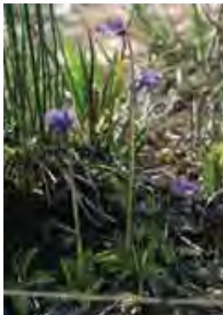
Tučnica obyčajná ( Pinguicula vulgaris )

( Epipactis palustris ). Ojedinelý je nález lyžičníka ( Cochlearia pyrenaica ). Revúca je súčasťou jadrového areálu výskytu vydry riečnej ( Lutra lutra ) v Západných Karpatoch. Zistený bol pomerne pestrý zoobentos (83 druhov), početné druhy bezstavovcov, rýb, oboživelníkov, plazov, vtákov aj cicavcov viazaných na biotopy tvoriace územie alebo vyskytujúce sa v jeho okolí.