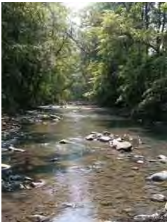
Rieka Revúca má pestré a stabilné brehové porasty