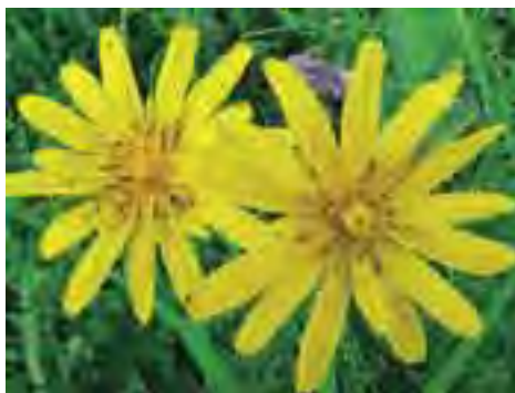
Kozobrada východná ( Tragopogon orientalis )