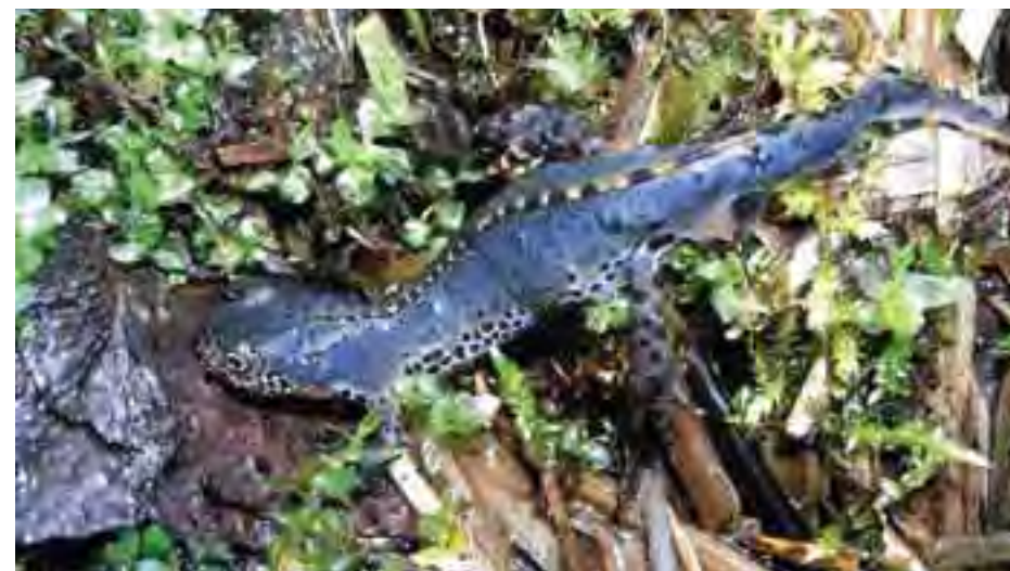
Mlok vrchovský ( Triturus alpestris )