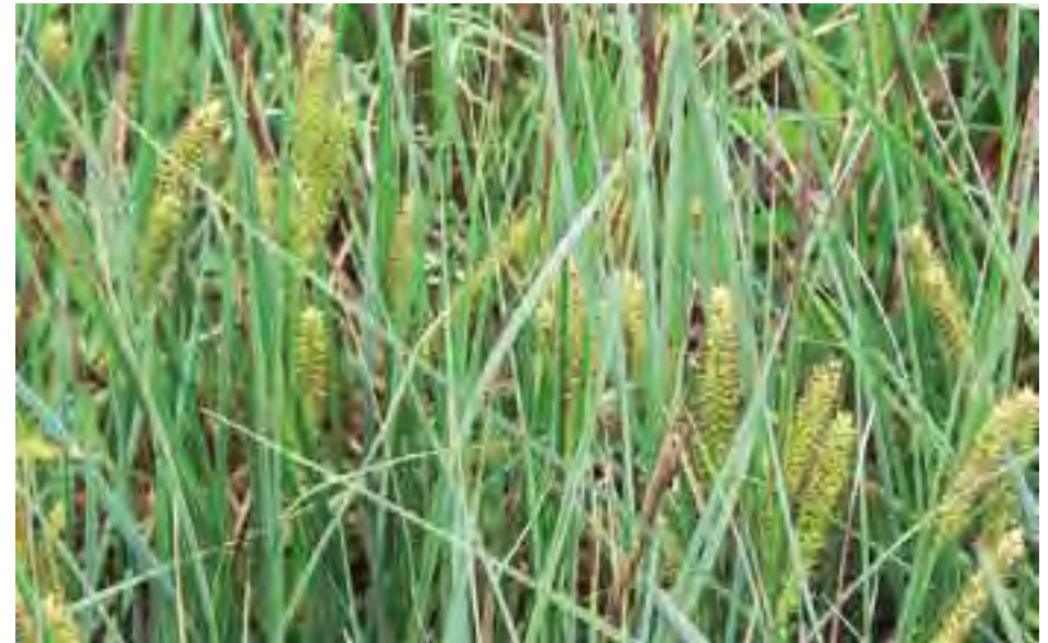
Ostrica zobáčikátá ( Carex rostrata )

Z botanického hľadiska patria k najzaujímavejším slatinným biotopom s výskytom vzácných, ohrozených a fytogeograficky významných druhov. Zaujímavé v nich sú napr. prvosienka pomúčená ( Primula farinosa ), tučnica obyčajná ( Pinguicula vulgaris ), bezkolonec belasý ( Molinia caerulea ), ale aj rôzne druhy nízkych ostríc ( Carex sp.) a zástupcov čelade vstavačovité ( Orchidaceae ), z ktorých sú najrozšírenejšie vstavačovec májový ( Dactylorhiza majalis ) a kruštík močiarny