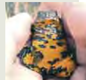
Kunka žltobruchá ( Bombina variegata )