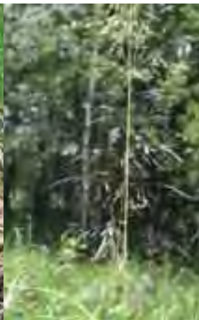
Bezkolonec belasý ( Molinia caerulea )