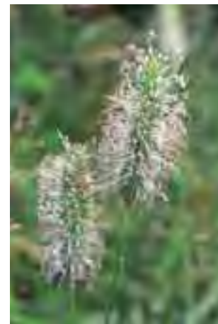
Timotejka lúčna ( Phleum pratense )