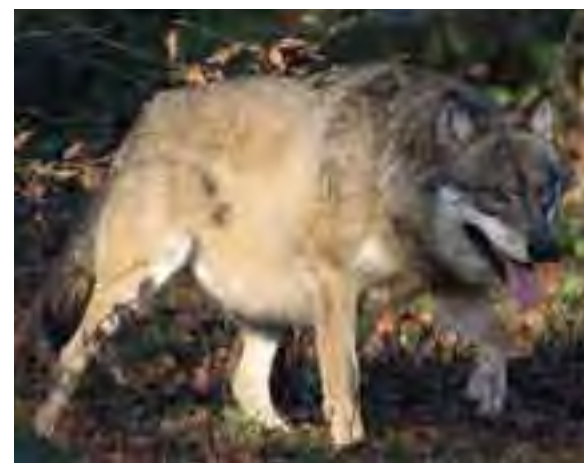
Vlk dravý ( Canis lupus )