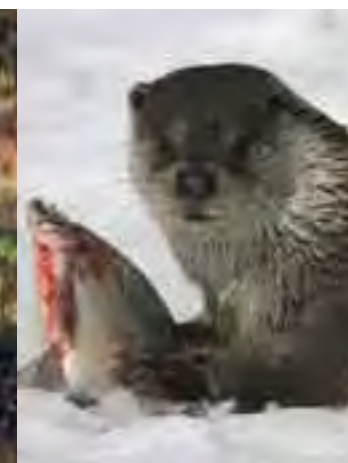
Vydra riečna ( Lutra lutra )