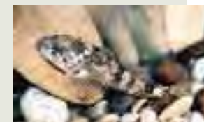
Hlaváč bieloplutvý ( Cottus gobio )