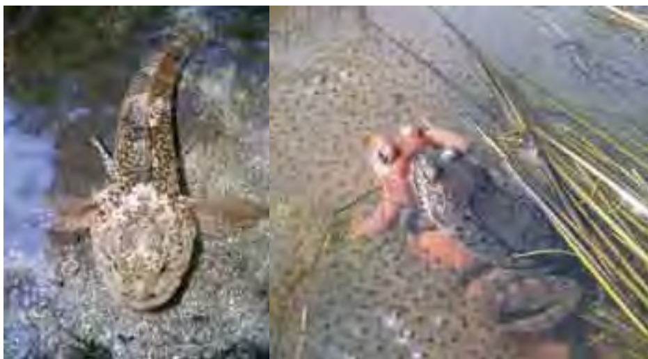
Hlaváč pásoplutvý ( Cottus poecilopus )

zazemňovanie a pod.) ovplyvňované aj ľudskou činnosťou vykonávanou v ich blízkosti. Na stav živočíšnych spoločenstiev vodných tokov má výrazný vplyv prítomnosť bariér obmedzujúcich migráciu organizmov a odbery pitnej a úžitkovej vody. Do brehových porastov a spoločenstiev na nive toku prenikajú invázne druhy rastlín.