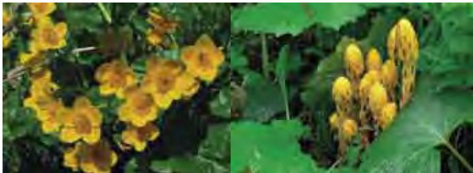
Záružlie močiarné ( Caltha palustris )

Časť územia je chránená od roku 1980 v kategórii prírodná pamiatka a časť od roku 2002 v kategórii chránený areál. Územie tiež predstavuje významný biokoridor a krajinársky cenný prvok v poľnohospodársky a rekreačne využívannej krajine. Platí v ňom 4. stupeň ochrany podľa zák. č. 543/2002 Z.z. o ochrane prírody a krajiny, ktorý umožňuje zachovanie prírodných hodnôt územia a zároveň aj jeho primerané trvalo udržateľné využívanie.