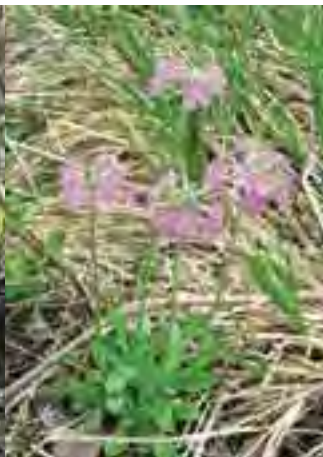
Prvosienka pomúčená ( Primula farinosa )