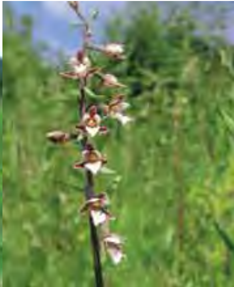
Kruštík močiarny ( Epipactis palustris )