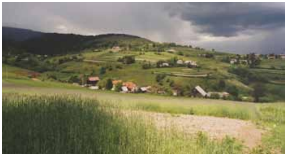
Juhovýchodné Podpolanie – Hriňovské lazy

Negatívne sa prejavuje aj rušenie vtáctva v období hniezdenia a to rekreačnými aktivitami alebo samotným obhospodarovaním krajiny.