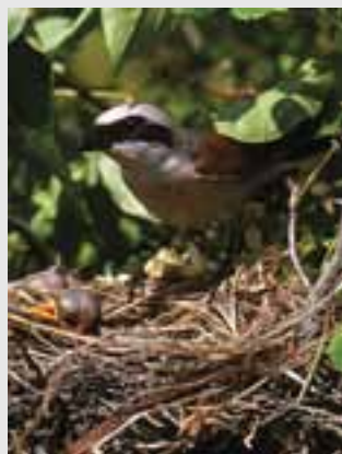
Strakoš kolesár ( Lanius minor )