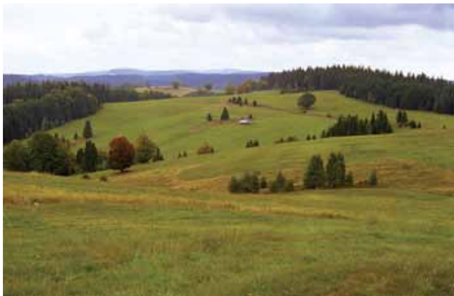
Horské lúky na Záklukách

Identifikačný kód územia: SKCHVU022 Nadmorská výška: 355-1458 m n. m. Rozloha: 32 538,18 ha