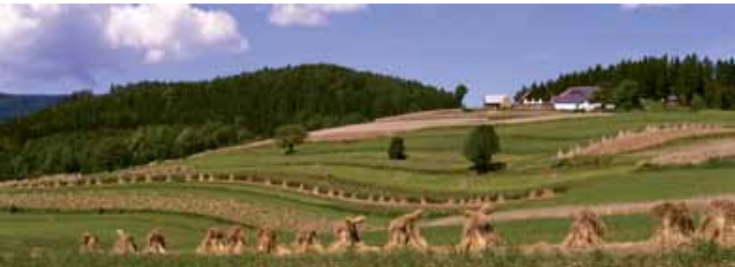
Terasovité polička v Snohách