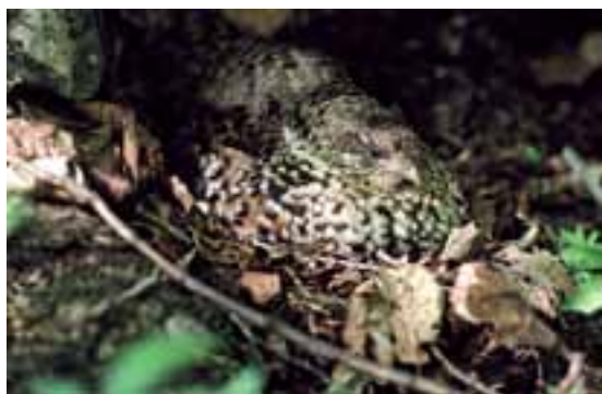
Jariabok hôrny ( Bonasa bonasia )