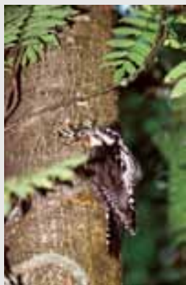
Ďateľ trojprstý ( Picoides tridactylus )

>1% – v území hniezdi viac ako jedno percento národnej populácie druhu