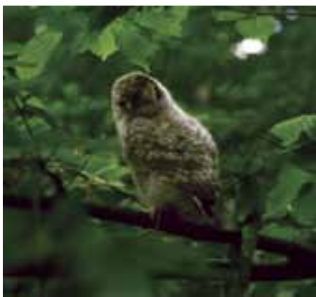
Sova lesná ( Strix aluco ) – mláďa