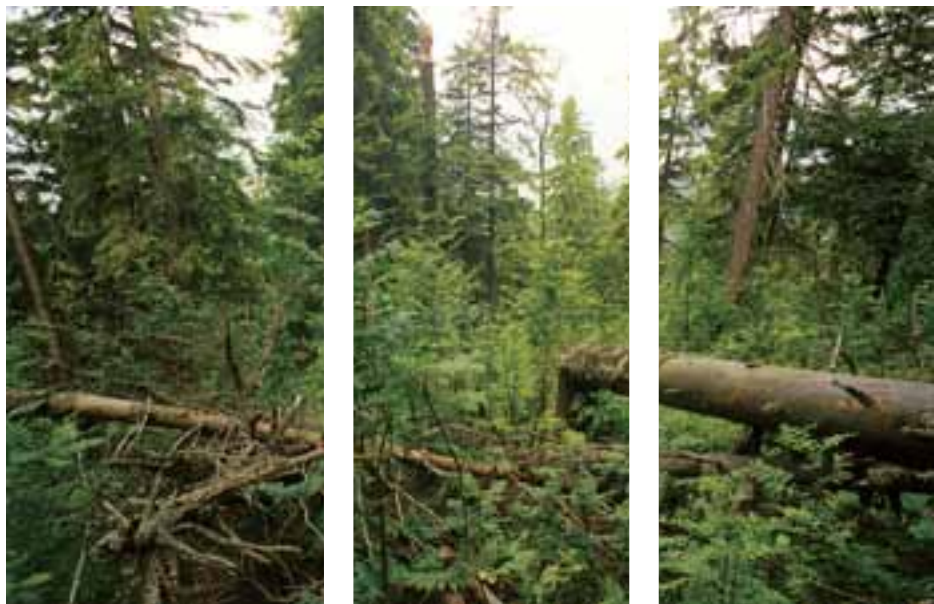
Interiér NPR Zadná Poľana

Za zakázané činnosti, ktoré môžu mať negatívny vplyv na predmet ochrany CHVÚ Poľana, sa považujú (§2 návrhu vyhlášky):