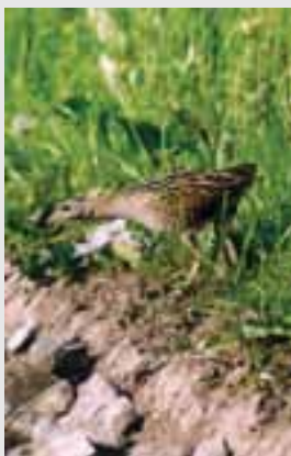
Chriaštel poľný ( Crex crex )