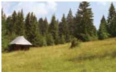
Pasienky pod Mincou

Vypracovaniu programu starostlivosti bude predchádzať jeho prerokovanie s vlastníkmi a užívateľmi územia. Nezávisle na tomto procese môžete k obsahu návrhu programu starostlivosti už teraz kontaktovať pracovníkov Správy Chránenej krajinej oblasti Poľana vo Zvolene.