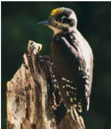
Ďateľtrojprstý ( Picoides tridactylus )

CHVÚ Poľana je jedným z troch najvýznamnejších území na Slovensku pre výskyt a hniezdenie strakoša kolesára a škovránka stromového a zároveň sa tu vyskytuje a pravidelne hniezdi viac ako 1% slovenskej populácie muchárika bielokrkeho, muchárika červenohrdlého, jariabka hôrneho, tetrova hlucháňa, ďatľa čierneho, ďatľa bielochrbtého, ďatľa trojprstého, ďatľa hnedkavého, žlny sivej, krutihlava hnedého, chriašťaľa poľného, prepelice poľnej, včelára lesného a prhlviara čiernohlavého.