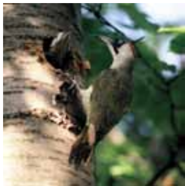
Žlna zelená ( Picus viridis )

Zásady starostlivosti o územie s cieľom zachovania predmetu ochrany upravuje program starostlivosti o chránené vtáčie územie. Program starostlivosti určuje opatrenia na zabezpečenie sústavnej starostlivosti potrebnej na usmerňovanie vývoja pre zachovanie alebo dosiahnutie priaznivého stavu populácií vybraných druhov vtákov. Za priaznivý stav druhu sa považuje taký stav, keď údaje o populačnej dynamike druhu naznačujú, že sa dlhodobo udržuje ako životaschopný prvok svojho biotopu, prirodzený areál druhu sa nezmenšuje a existuje dostatok biotopov na dlhodobé zachovanie jeho populácie.