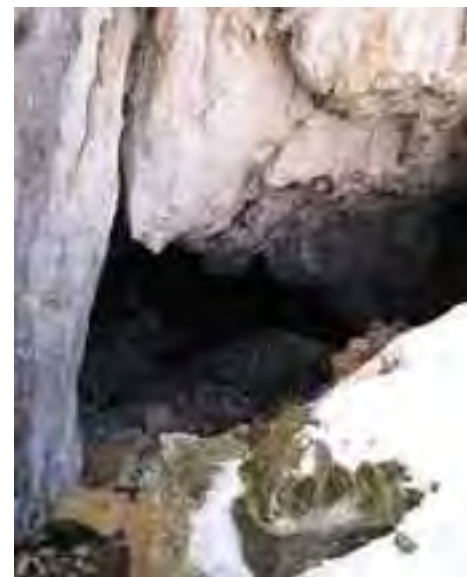
Jaskyňa Červeného mnícha