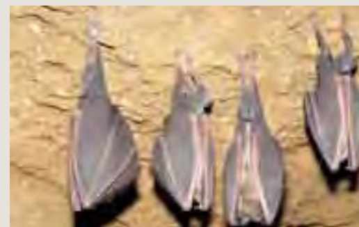
Podkovár veľký ( Rhinolophus ferrumequinum )