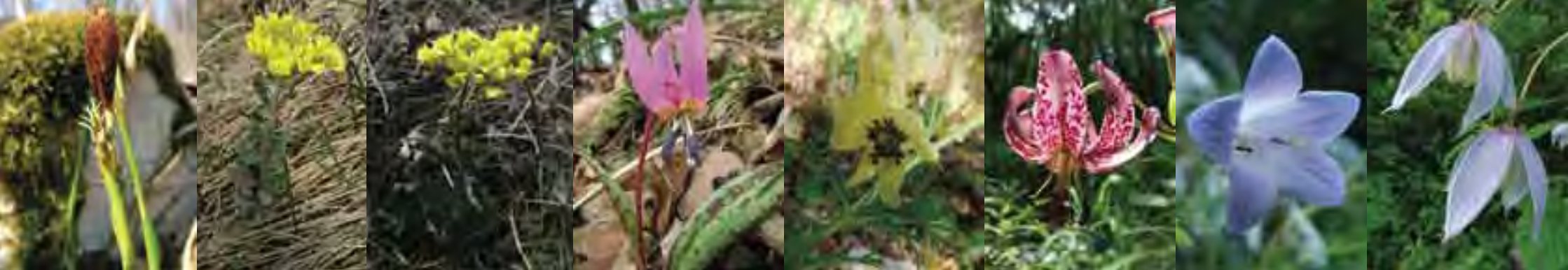
Ostrica krátkošijová ( Carex brevicollis )