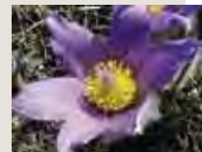
Poniklec veľkokvetý ( Pulsatilla grandis )

Vyššie rastliny črievičník papučkový Cypripedium calceolus poniklec veľkokvetý Pulsatilla grandis