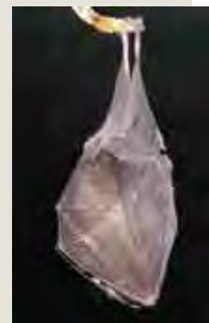
Podkovár malý ( Rhinolophus hipposideros )