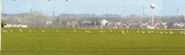
Dropy fúzaté v CHVÚ Sysľovské polia

Táto významná úloha poľnohospodárov bola vzatá do úvahy aj pri tvorbe projektu Ochrana dropa fúzatého na Slovensku , ktorý v roku 2005 schválila Európska komisia a je spolufinancovaný prostredníctvom Finančného nástroja pre životné prostredie, známejšieho pod skratkou LIFE, ktorý v mene Európskeho spoločenstva riadi Európska komi-