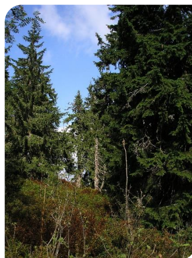
Čučoriedková smrečina v PR Paráč

Podporujú spoločenstvo a spôsob ich obživy. Výsadba stromov pomôže komunitám dosiahnuť dlhodobú ekonomickú a environmentálnu udržateľnosť a poskytnú im potravu, energiu a príjem. Niektoré štúdie dokumentovali, že v školách s lesným porastom sa znížil výskyt astmy a ochorenia pľúc žiakov a výsadba stromov tiež pomohla žiakom s poruchou sústredenia, koncentrovať sa na dlhší čas. Zároveň vysádzanie stromov má aj priamy vplyv na zníženie trestnej činnosti, zvyšuje sociálnu súdržnosť a má ďalší rad sociálnych a psychologických výhod.